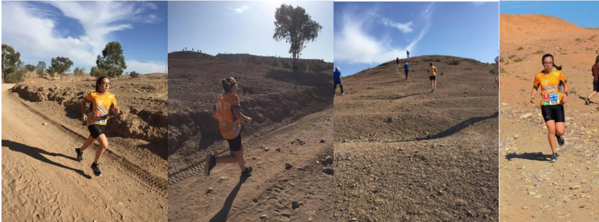
Trail 9 km au profit de l'INSAF le 16/02