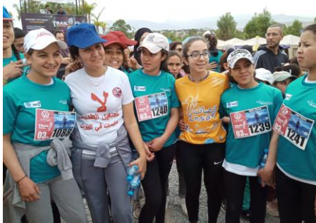
Photographies de groupe avec les filles de Dar INSAF